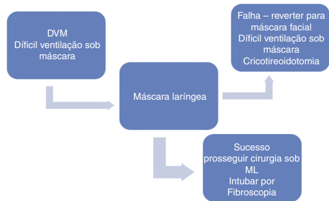
Figura 1 Dificil ventilação sob máscara facial (DVM).

um desafio a todos os colegas para diminuir esta diferença encontrada, principalmente em relação à disposição de equipamentos essenciais.